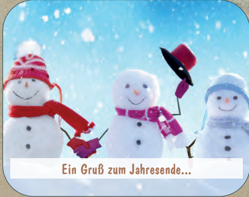
Ein Gruß zum Jahresende...

Danke an alle, die sich gemeinsam mit uns - trotz vieler Herausforderungen - unablässlich der Aufgabe stellen, unseren ländlichen Raum lebenswert zu gestalten!