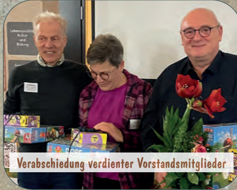
Verabschiedung verdienter Vorstandsmitglieder

Wir wünschen eine besinnliche Weihnachtszeit und einen guten Start ins Jahr 2025!