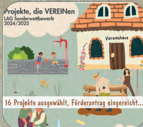
16 Projekte ausgewählt, Förderantrag eingereicht...

Vorherige Abstimmung mit Regionalmanagement empfehlenswert!