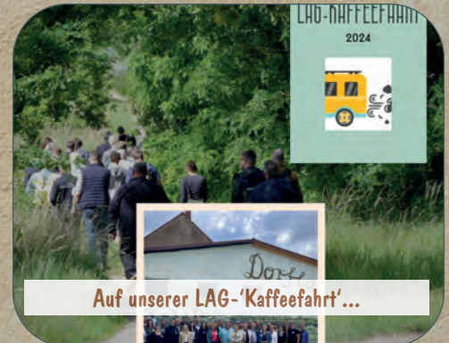
Auf unserer LAG-'Kaffeefahrt'...

...haben wir in diesem Jahr vielen Mitstreitern tolle Projekte aus unserer LEADER-Region zeigen können. Begeistert waren wir alle von dem Stolz, mit dem uns diese präsentiert wurden! Wohl verdient, denn neben den Kommunen gibt es zahlreiche Vereine und Private oder auch Kleinunternehmen, die mit ihrem Engagement einen großen Beitrag dazu leisten, unseren ländlichen Raum lebenswert zu gestalten! Dankeschön.